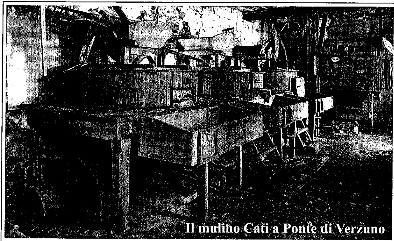
Il mulino Cati a Ponte di Verzano